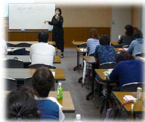
～啓発を目的とした講演会～

*ペアレント・メンターは専門家ではないため、発達障がいに関する講義などは実施できません。