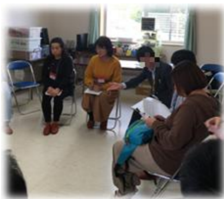
～少人数グループでの交流会～