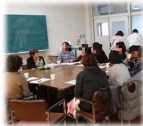
～小学校の保護者との交流会～